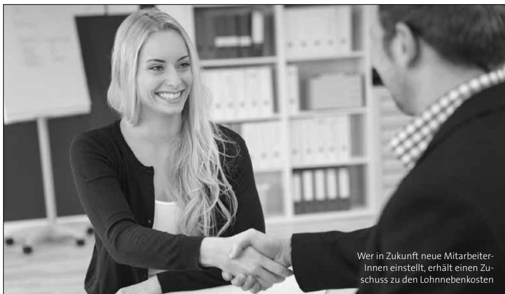
Wer in Zukunft neue MitarbeiterInnen einstellt, erhält einen Zuschuss zu den Lohnnebenkosten