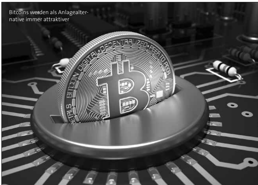
Bitcoins werden als Anlagealternative immer attraktiver