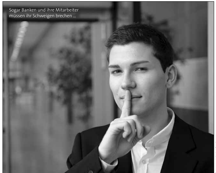
Sogar Banken und ihre Mitarbeiter müssen ihr Schweigen brechen ...

Um die Steuerreform zu finanzieren braucht die Regierung Mehreinnahmen aus der Betrugsbekämpfung von 1,9 Mrd. Euro. Um potentiellen Steuer-sündern auf die Schliche zu kommen, wird das Bankgeheimnis aufgehoben und ein Kontenregister eingeführt.