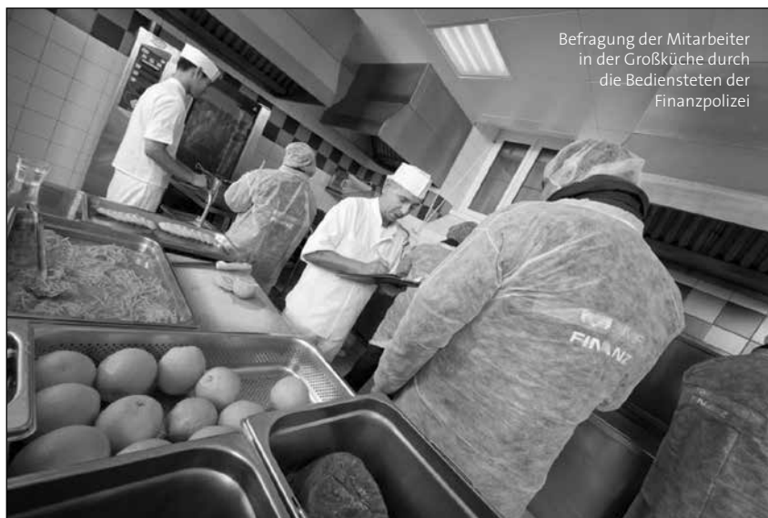
Befragung der Mitarbeiter in der Großküche durch die Bediensteten der Finanzpolizei